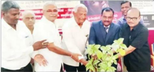
ವಿಶ್ವ ಹಿರಿಯ ನಾಗರಿಕರ ಕೋಷ್ಠಕ ಜಾಗೃತಿ ದಿನಾಚರಣೆ ಅಂಗವಾಗಿ ಆಯೋಜಿಸಿದ್ದ ಕಾನೂನು ಸಾಕರತಾ ಕಾರ್ಯಕ್ರಮ ಉದ್ಘಾಟನೆಯಾಚ.