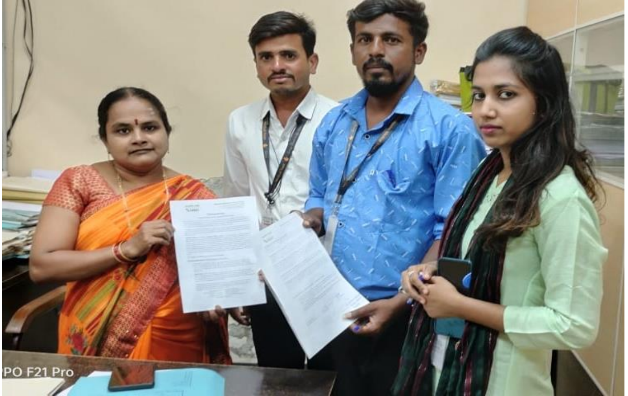
Samuktha Karnataka News Paper